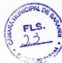
DALVECIR APARECIDO BONORA